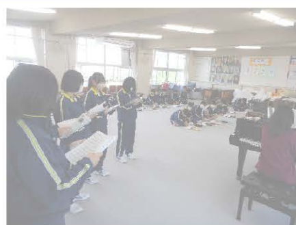
音楽の授業 (合唱練習)