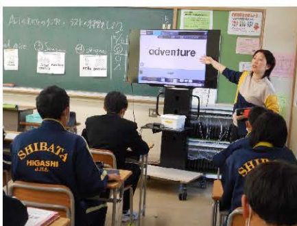
英語の授業 (ICT の活用)