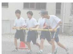
6月18日 1学年委員会 体育祭学年種目の練習光景

生徒の皆さんからの「命を守るため」の主体的な校則の見直しの提案があり、実現しました。と同時に、「シャツのすそを入れるのは、どのような時」なのかを自ら考え実行にうつしていくことも大切になってきます。生徒の皆さん自身が自ら考え、判断していく力に期待しています。