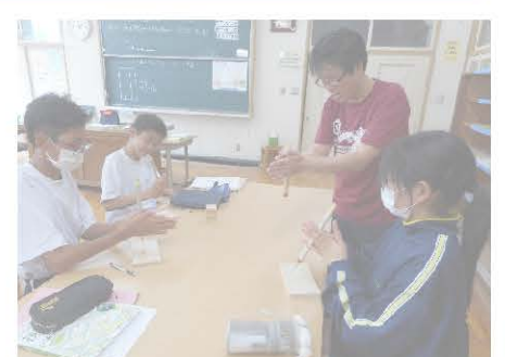
技術の授業 (道具の使い方)